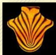
Big Red Machine Big Red Machine Jagjaguwar. 2018

D'ALLÀ / L'utilització de la sonoritat i l'ambient, amb les veus tractades amb cura, segell personal i atrevit, sense fer ritmes accelerats ni intensitat de les seves cançons enlairan a qui les escolta. La signatura de Bon Iver està ben present, una delícia a les orelles.