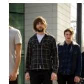
Maybeshewill + Flood of Red + Exxasens @ Sala Razzmatazz 3