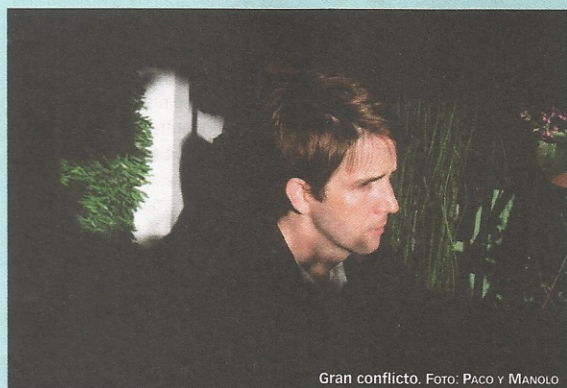
Gran conflicto.

"In Conflict" arranca con "I Am Not Afraid" , masterpiece de pop de cámara —cuerdas repetitivas a lo Lige-