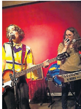
Les Sueques.

Utilizando el catalán como vehículo de expresión que, como ya se ha demostrado en numerosas ocasiones, se adapta mejor al pop que el castellano, el disco incluye catorce canciones con la mirada bien fija en otras tantas referencias. Así, el disco comienza con una Ara es aquí que parece firmado por los primeros The Pastels. La sigue una