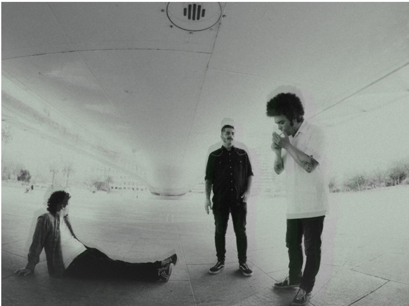
Krautrock, psicodèlia i la dignificació d'un ofici