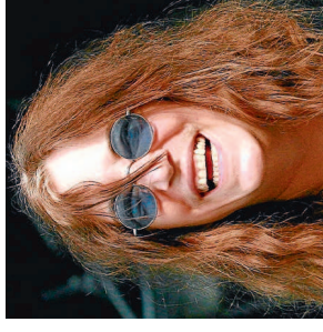
Patti Smith Cantante