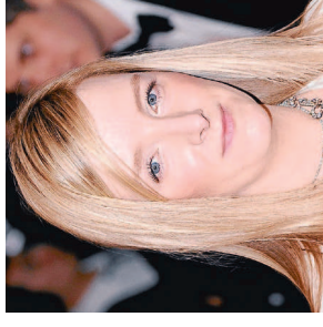
Sarah Burton Diseñadora

Emily Watson, nominada dos veces al Oscar, quiere un papel, cualquiera. "En serio, si sólo es por dos semanas, la pasra está bien y además si el rodaje se realiza aquí en Londres, interpreto hasta a un caballo si hace falta", afirma en la revista Brigitte .