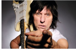
Cultura Inquieta celebra su quinta edición por todo lo alto