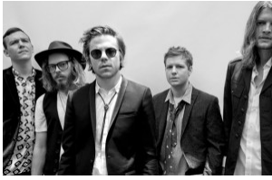
La Recomendación de hoy... Cage the Elephant