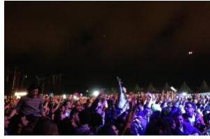
Así vivimos el Sansan Festival