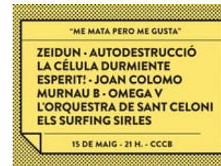
BCNmp7 / "Me mata pero me gusta": una genealogia