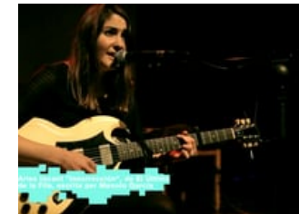
Primera Persona 2014 · Aries versiona El Último de

POSTS MÉS LLEGITS EN ELS DARRERS 30 DIES