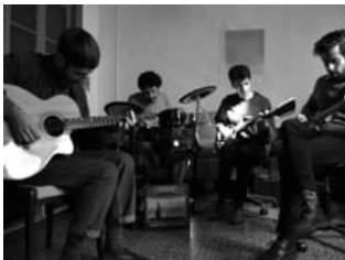
El millor disc del 2014