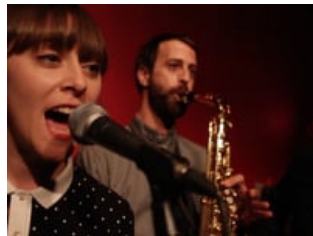
Live Track: Supergrupo - Bugulú (Los Albas cover)