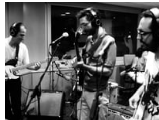
Mujeres @ iCat.cat radio